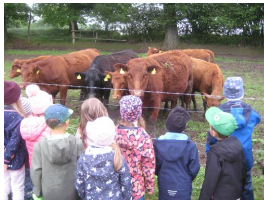
Besuch beim Haasn timerhof in Eckersberg