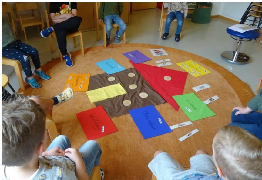
Unser Projektthema „Do bin i dahoam“

Durch genaues Beobachten und Zuhören (besonders in der Freispielzeit) finden wir mit den Kindern unsere Projektthemen. Bei der Planung der Projekte berücksichtigen wir den ganzheitlichen Lernansatz, sodass wir stets zu jedem Bildungs- und Erziehungsbereich passende Lernangebote auswählen.