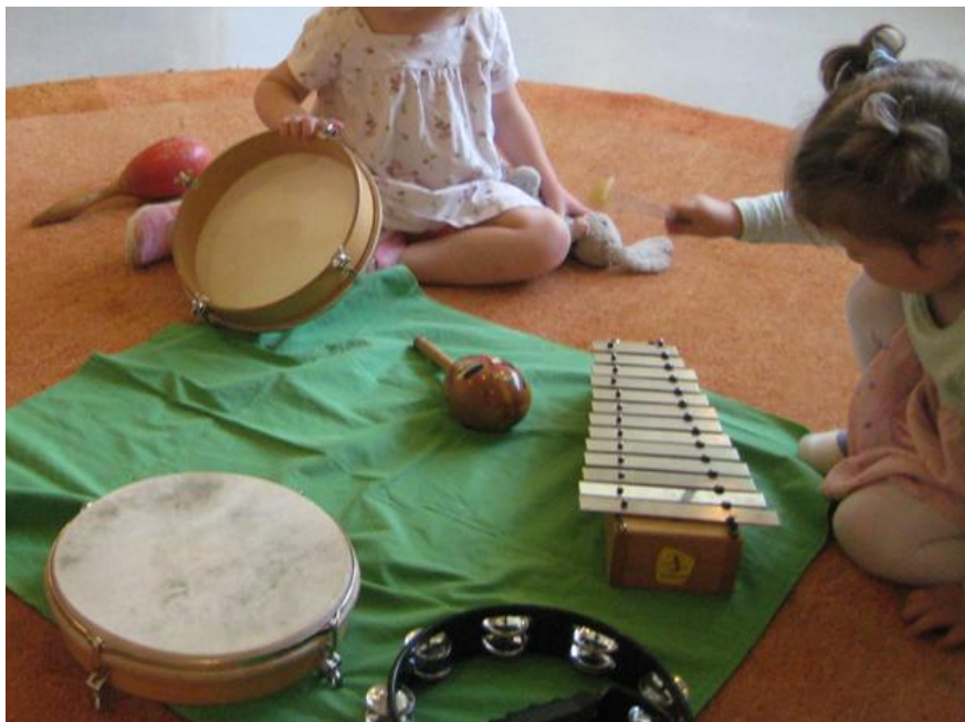
„Musizieren mit Orff-Instrumenten“

Neben „körpereigenen Instrumenten“ setzen wir auch Rhythmusinstrumente und Stabspiele ein.