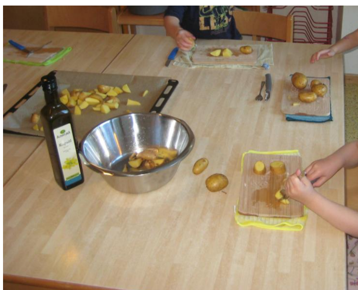
„Wir verwerten unsere selbst angebauten Kartoffeln“

Durch diese ganzheitliche Förderung erleben die Kinder, dass sie selbst einen wichtigen Beitrag zu ihrer Gesundheit leisten können. Sie entwickeln ein positives Selbstbild und erwerben grundlegende Kompetenzen für eine gesunde Lebensweise, die sie auch über die Kindergartenzeit hinaus begleiten.