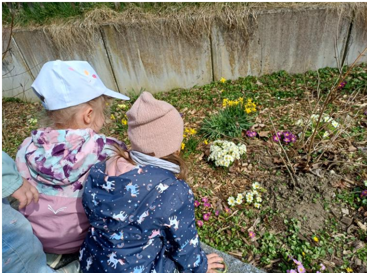
„Wir entdecken die Spuren des Frühlings“