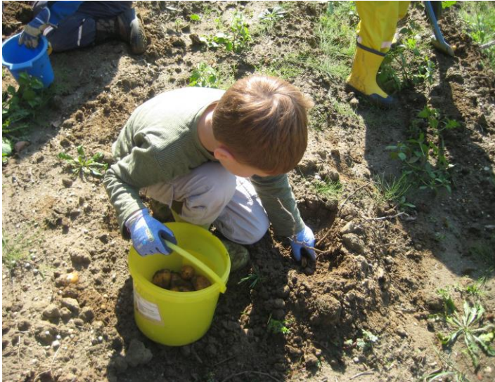
„Wir legen Kartoffeln auf unserem Acker“