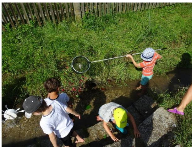
„Kneippkuren am Bach“

Zum Verweilen und Balancieren liegen alte Baumstämme bereit. Vor dem Haus ist ein Schlittenhang und wenn wir das Tor öffnen, stehen wir direkt vor Wald und Wiese.