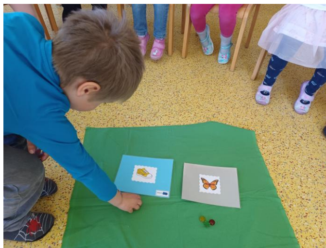
Wir entscheiden gemeinsam unser Stuhlkreissspiel

Durch diese Form der Mitgestaltung stärken wir das Selbstbewusstsein der Kinder, fördern ihre sozialen Kompetenzen und unterstützen sie darin, demokratische Grundwerte wie Fairness, Rücksichtnahme und Wertschätzung zu entwickeln. So wird der Kindergarten zu einem Ort, an dem Kinder Beteiligung als selbstverständlichen Teil ihres Alltags erleben und lernen, respektvoll und verantwortungsbewusst miteinander umzugehen.