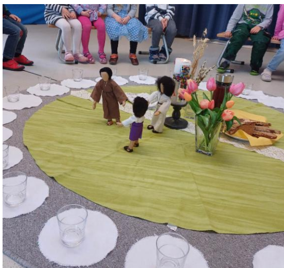
Religiöse Erzählung aus dem neuen Testament

Kinderkirchen, Kirchenbesuche und das Erleben der Feste des Kirchenjahres sind feste Bestandteile unseres Kindergartenalltags. Das tägliche Gebet ist in den Tagesablauf integriert. Gelebtes Christentum zeigt sich für uns vor allem im respektvollen Miteinander, im Vorbild der pädagogischen Fachkräfte und in der Anerkennung jedes Kindes in seiner Einzigartigkeit. Die Konfession spielt bei der Aufnahme keine Rolle. Wichtig ist, dass Eltern unsere religiöse Arbeit mittragen. Ziel ist es, den Kindern christliche Werte zu vermitteln und zugleich Toleranz und Offenheit gegenüber Andersdenkenden zu fördern.