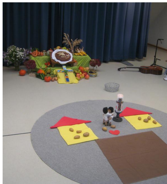
Kinderkirche zu Erntedank