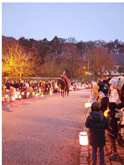
St. Martins-Umzug in Tegernbach

Die Zusammenarbeit mit dem Jugendamt ergänzt die Kooperation mit anderen Fachdiensten, Schulen oder Therapien, sodass die Kinder umfassend begleitet werden. Das Jugendamt steht dem Kindergartenteam bei Fragen zur Kindesentwicklung, Frühförderung oder familiären Herausforderungen beratend zur Seite.