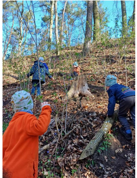
„Der Wald im Herbst“